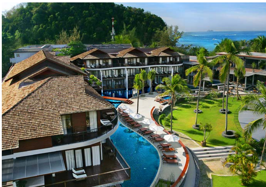
▲ SALA Talay Resort and Spa

靠近奥南区的海滩，处于国家公园的范围内，这里有绵延的白色沙滩。因为是浅滩，并不适合游泳，但却是晒太阳的好地方。许多游客喜欢在这里铺上毯子看海野餐。