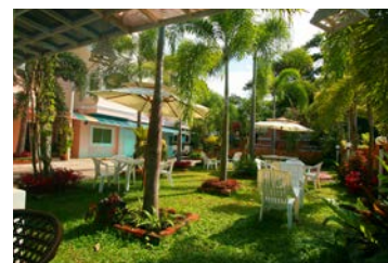
▼ Krisda Villa