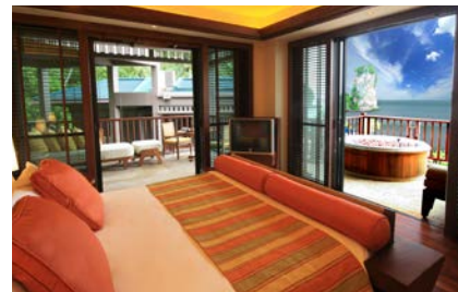
^ Centara Grand Beach Resort & Villas Krabi