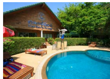
▼ Chaokoh Phi Phi Lodge