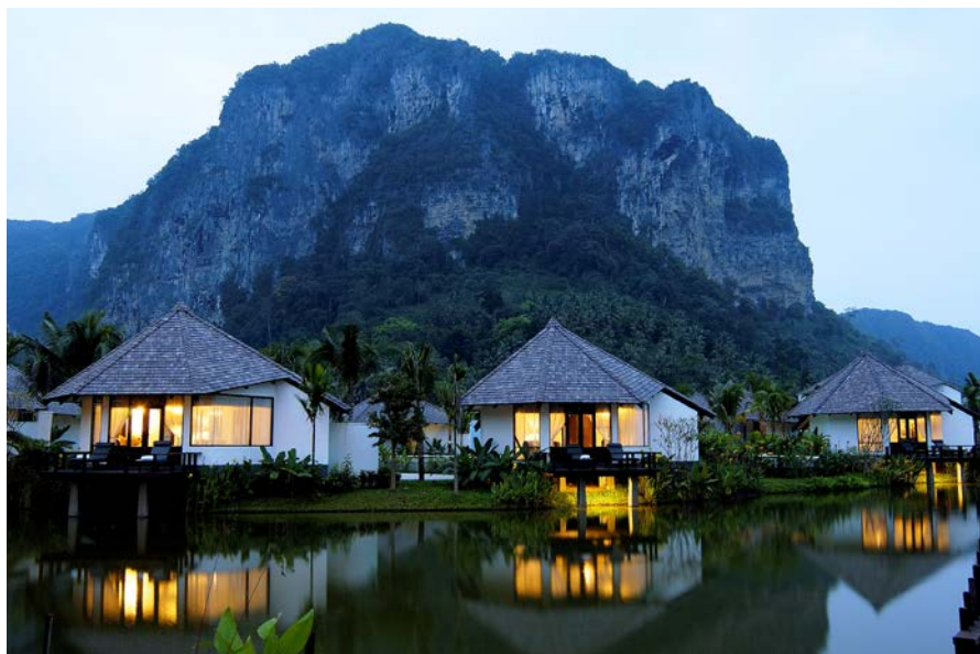
▲ Peace Laguna Resort & Spa

奥南是甲米最热闹的海湾,这里有一整条的夜市,路上尽是提供旅游服务的旅行社,路旁还有许多各式各样的餐厅。不管白天还是晚上,世界各地的旅人在此处穿梭在。这里的饭店种类也比较多,从海滨饭店、特色饭店到民宿有多种选择。奥南有码头,出海也方便,还有美丽的夕阳,来甲米旅行一定不要错过住在奥南。