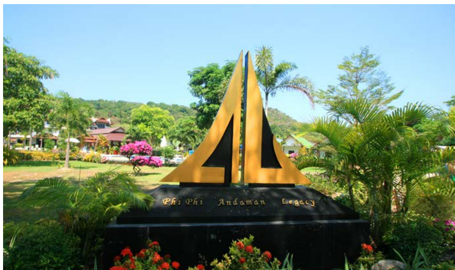
▲ Phi Phi Andaman Legacy Resort

皮皮岛的饭店都位于大岛上，饭店的选择不多，大部分是潜水客的小旅店。中型的饭店也少。由于岛很小并无法大量开发新饭店，岛上仅能步行，设施大多以简易方便为主。